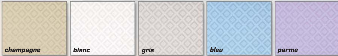
Les Satins losange 5 coloris