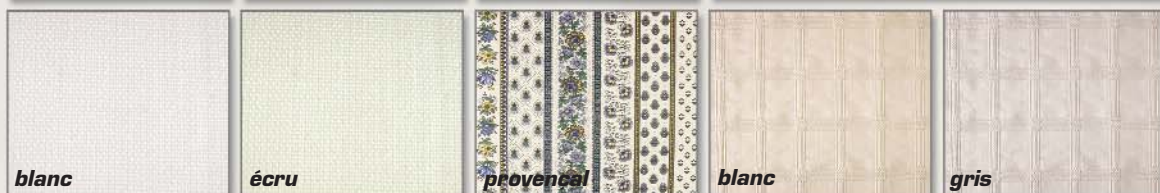
Les Cotons 5 coloris