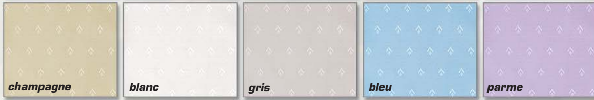
Les Satins empreinte 5 coloris