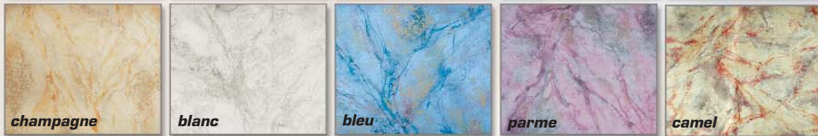
Les Satins marbrés 7 coloris