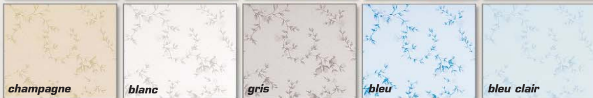
Les Satins fleurettes 7 coloris