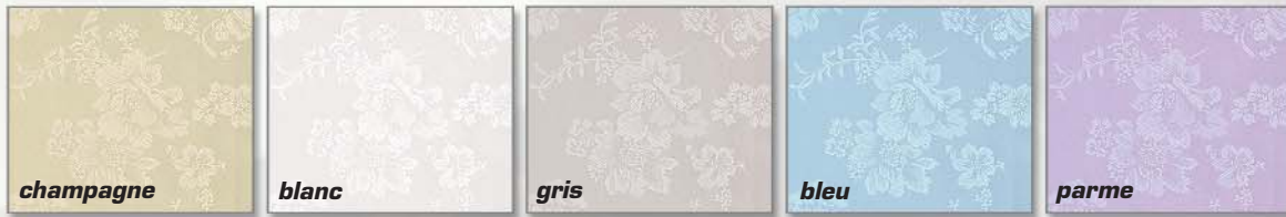
Les Satins brochés fleurs 5 coloris