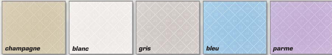
Les Satins damas 5 coloris